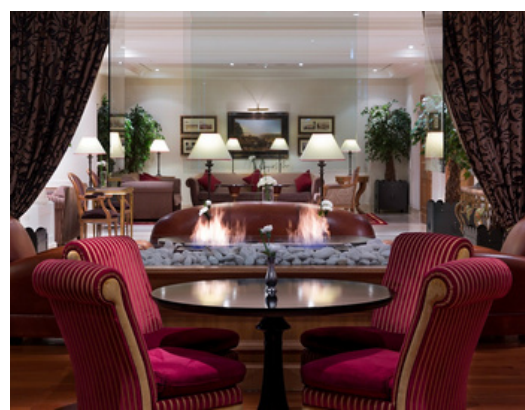
Le Bogie's Bar