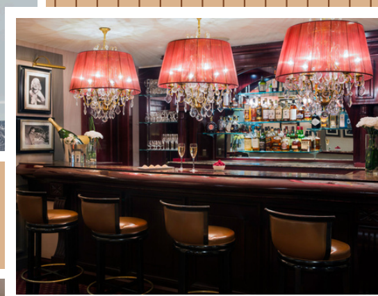
Le Bogie's Bar