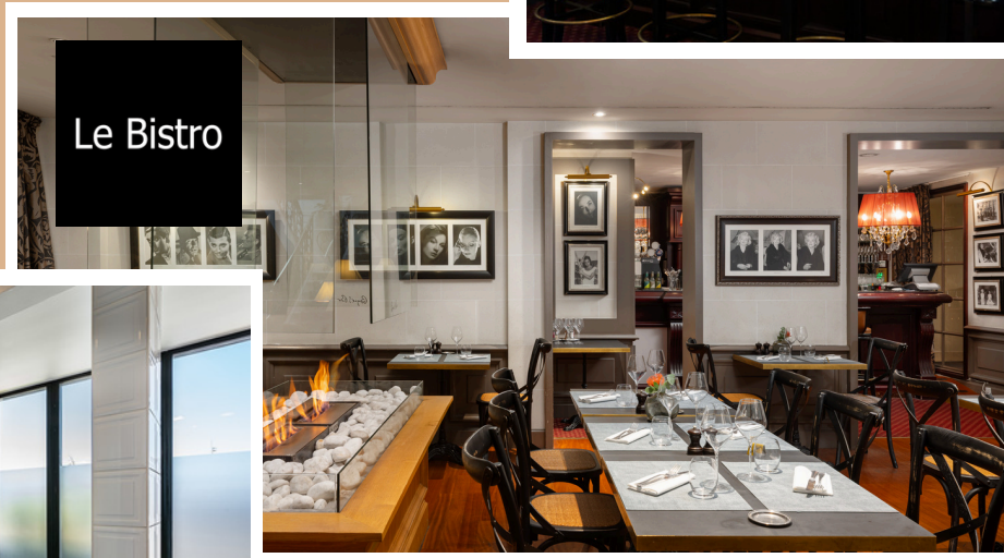
Restaurant le Bistro